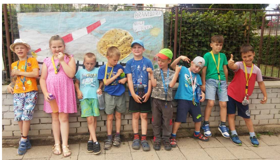
Přípravná třída - plakátové malování