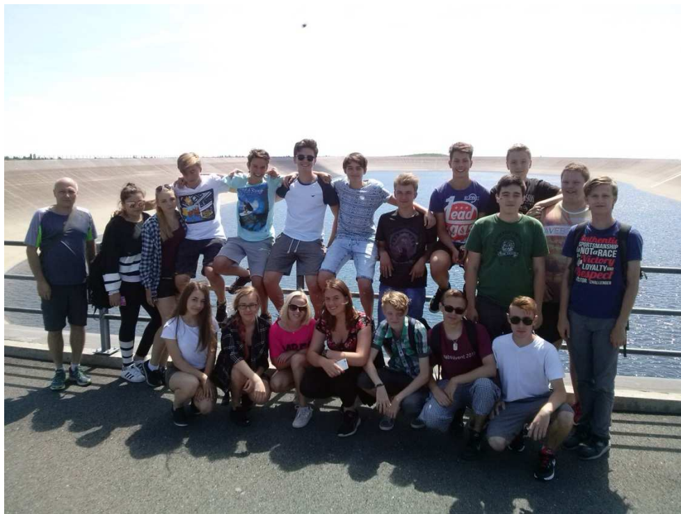
Exkurze Dlouhé Stráně

Zájmová činnost žáků naší školy probíhala pod záštitou společnosti Kroužky. Žáci se zapojili do celé řady odpoledních mimoškolních aktivit, tvořili, prohlubovali a rozvíjeli své záliby v oblasti logických her, v oblasti rukodělné, výtvarné, taneční i sportovní. Na vedení kroužků se podíleli naši pedagogičtí pracovníci i odborně proškolení lektori. Spolupráce tradičně pokračovala i s taneční skupinou X-trim.