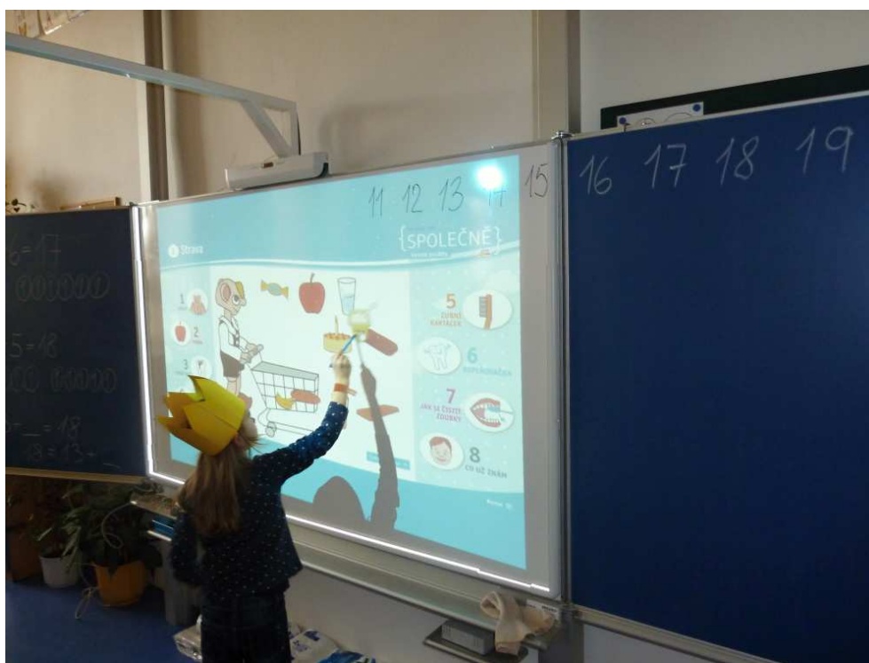
Práce s interaktivní tabulí - prevence zubního kazu