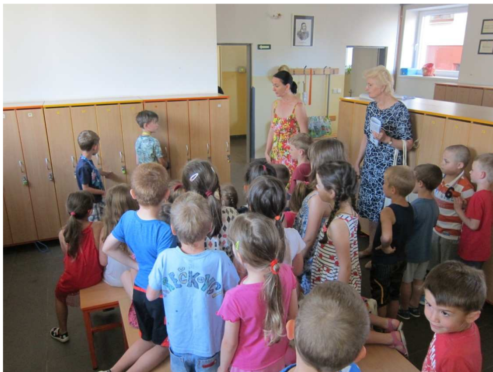
Adaptační program pro MŠ