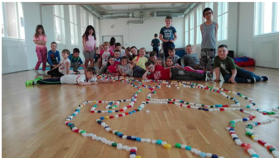
Psychomotorika v rámci Tv

V červnu jsme s paní učitelkou z přípravné třídy zorganizovaly krátký adaptační program také pro budoucí prvňáčky z Mateřské školy Modřice, aby na začátku školního roku mohl první den proběhnout s větším klidem a děti věděly, jak se zorientovat v šatně, kde jsou třídy a jak to chodí ve školní jídelně.