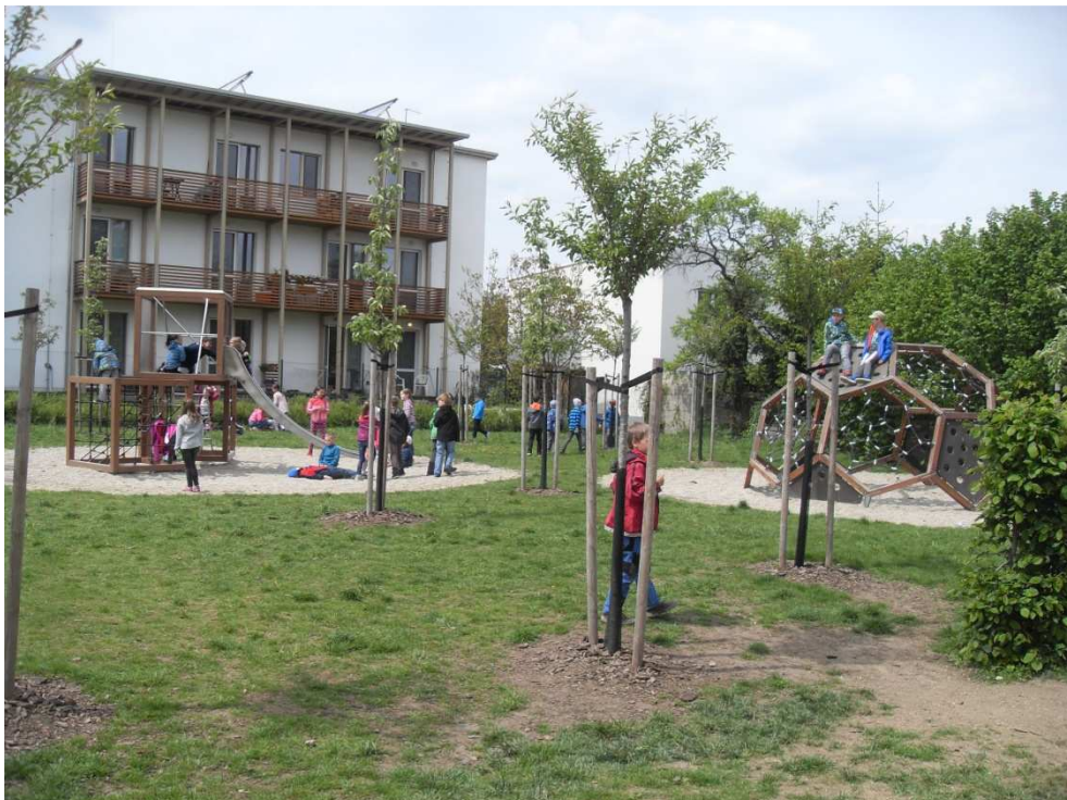
ŠD na zahradě