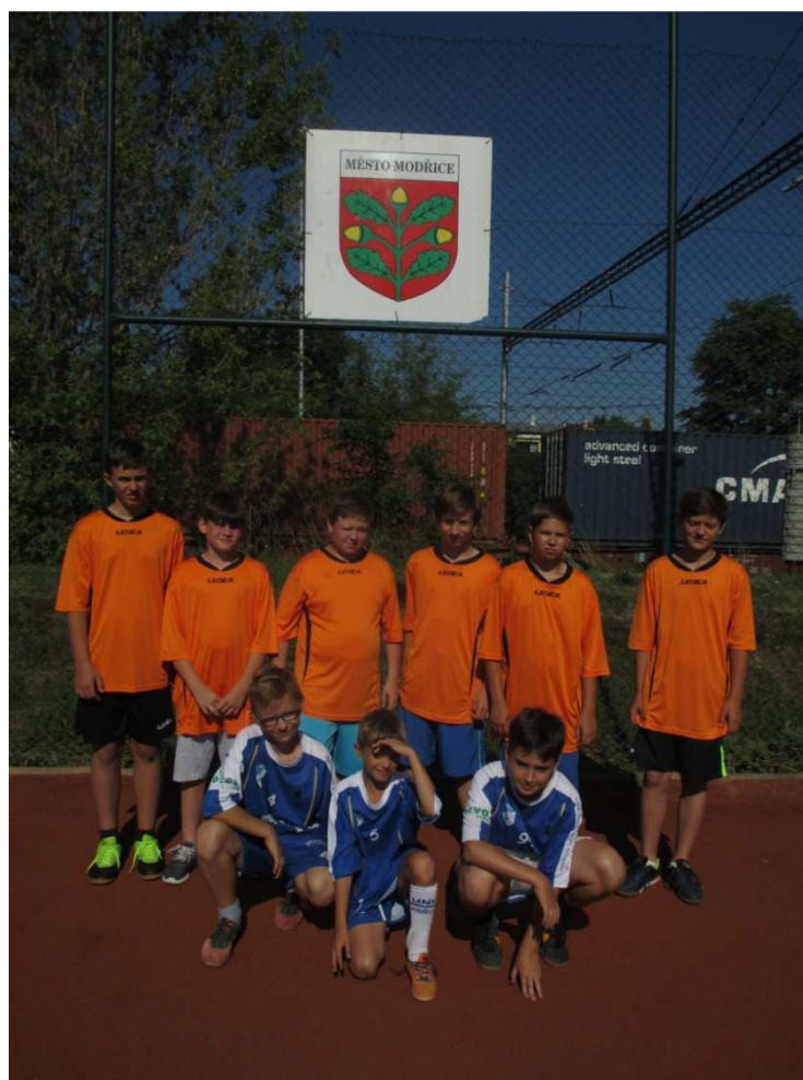
Přebor Brna v nohejbalu trojic

V budově na Komenského ulici se plánuje úprava vstupního prostoru, a sice nové zastřešení u vstupních dveří. Půjde o přístavek, který vytvoří jednak protihlučnou bariéru vzhledem k sousedním domům a současně poskytne vítanou ochranu rodičů čekajících na své děti ze ŠD před povětrnostními vlivy.