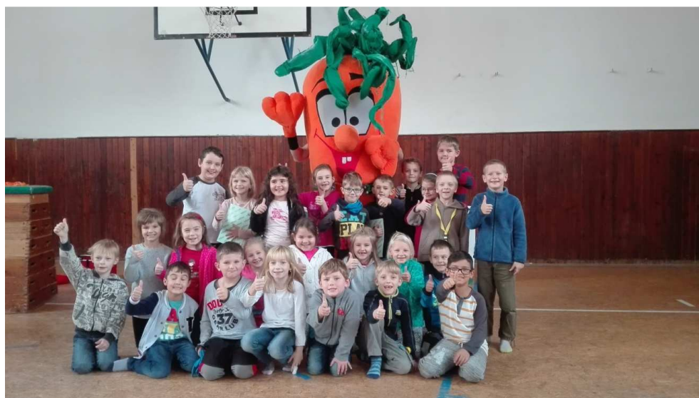
Projekt Ovoce do škol

Každým rokem přibude do naší kuchyně nějaké nové zařízení. Letos jsme pořídili nový mlýnek na maso a v plánu je ještě konvektomat s větší výrobní kapacitou.