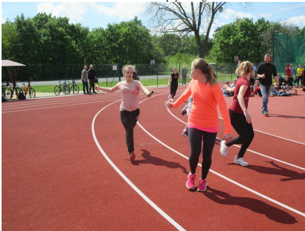
Pohár rozhlasu - štafeta