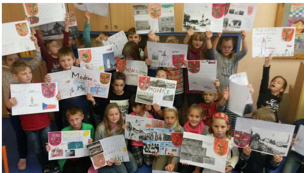
Projekt - Naše obec

Pedagogové dle možností zařazovali do výuky alternativnější metody, aby se vyučování stalo přitažlivějším a pestřejším. Pokračovalo se v třídních i celoškolských projektech. Velmi přínosná byla spolupráce s Gymnáziem na třídě Kapitána Jaroše v Brně, a to zejména v oblasti zeměpisu a fyziky. Aktivitu připravené a prezentované středoškolskými studenty v prostorách jejich laboratoří byly pro naše žáky velmi zajímavé a inspirativní.