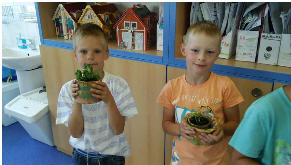
Přípravná třída - Den Země

Všechny aktivity byly prezentovány na školním webu, školních nástěnkách, i v místním modřickém Zpravodaji.