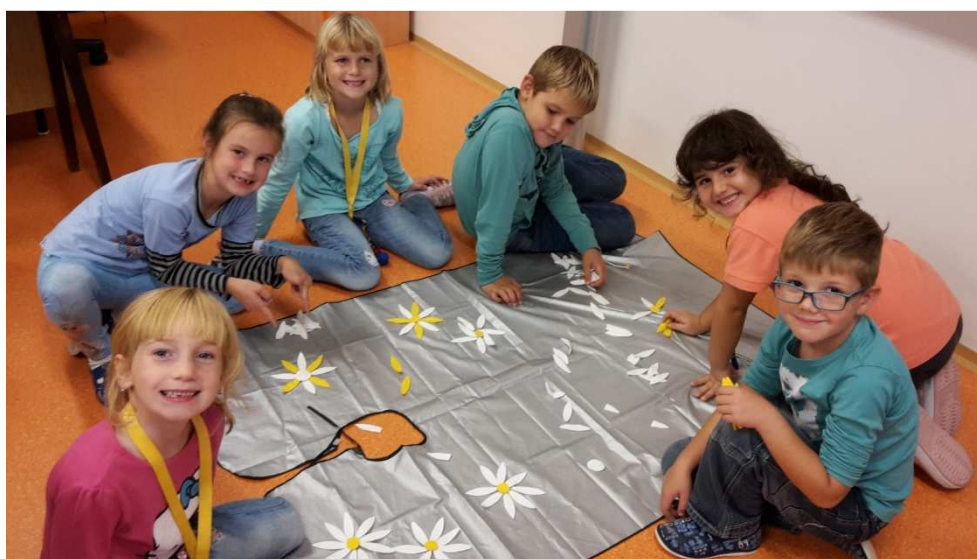
Školní družina - vytváření pláště pro babičku