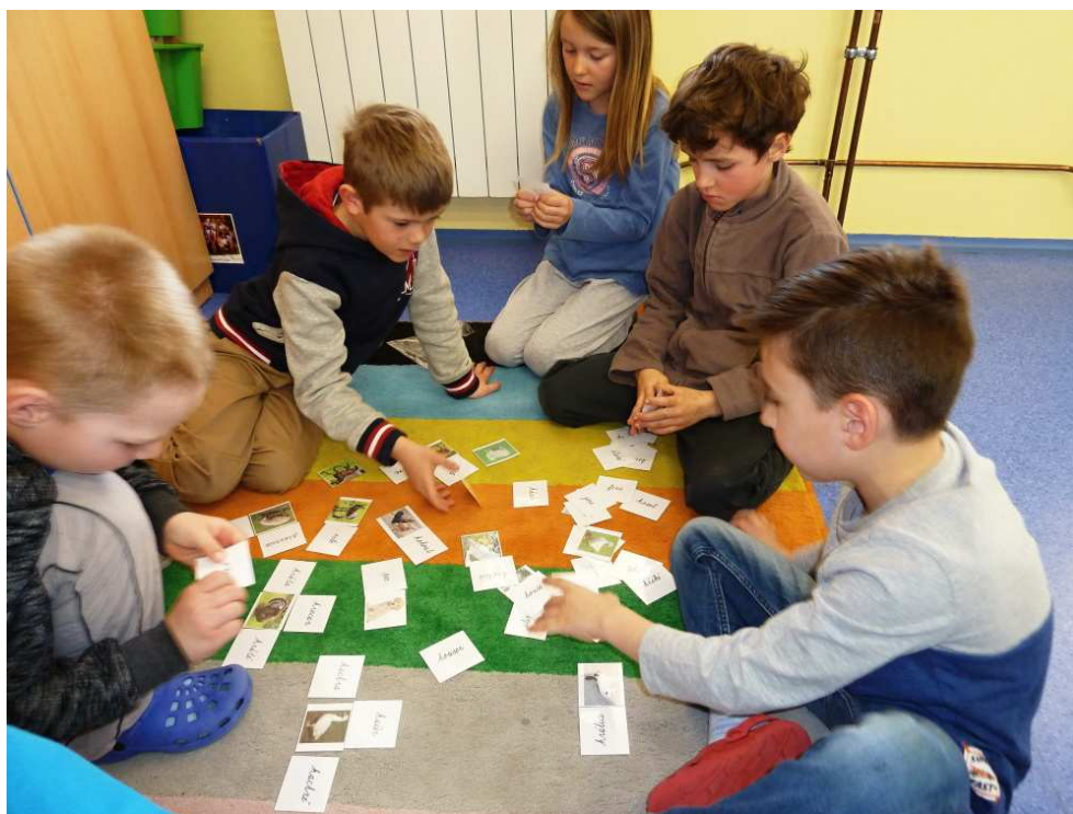
Skupinová práce - Projekt domácí zvířata

Aby poznání bylo poznáním, je vždy třeba vyjít ze školních lavic a zkoumat, poznávat a objevovat v praxi. K tomu jsou jedinečné exkurze, výlety a poznávací zájezdy. I těch se v letošním roce uskutečnila celá řada.