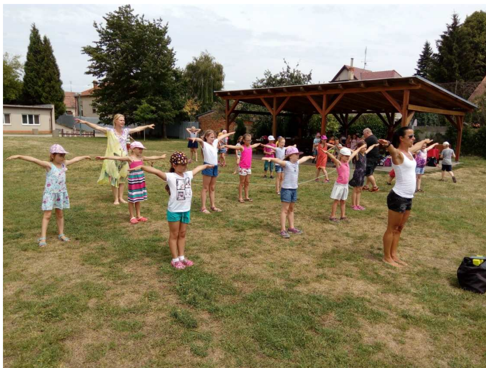
Družina - nacvičujeme na Akademii