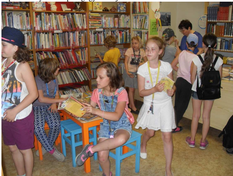
Školní družina v knihovně

Stabilně podporujeme další vzdělávání pedagogických pracovníků, a to akreditovanými školeními a vzájemnou spoluprací mezi ICT metodikem a spolupracovníky a mezi pedagogy navzájem.