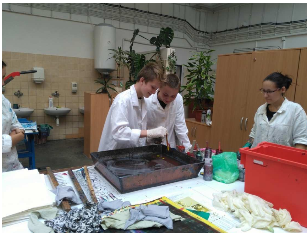
Zájmové dny - barvení papíru