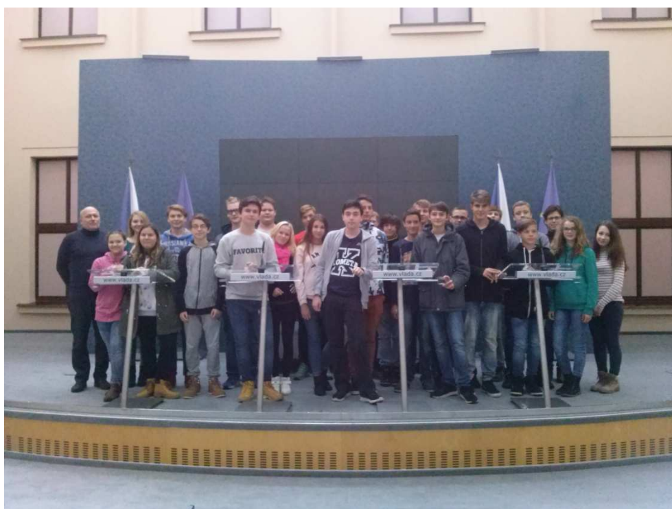
Praha - Úřad vlády ve Strakově akademii