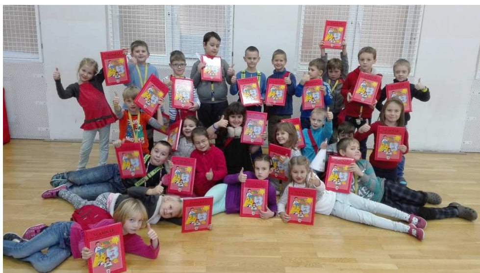
Už máme slabikář

Kontrolní činnost se týkala též veškeré školní dokumentace. Stále se zaměřujeme na práci asistentů pedagoga a naplňování plánů podpůrných opatření u integrovaných žáků. Na této kontrolní činnosti se podílí též výchovná poradkyně, školní psychologka, hospitace mohou probíhat i vzájemně mezi učiteli.