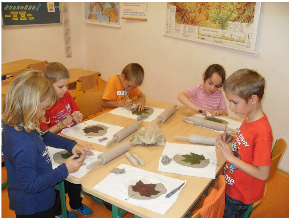
Práce s hlinou v ŠD

školy dobře. Navíc v rámci testování Stonožka, mohli průběžně sledovat svůj individuální posun.