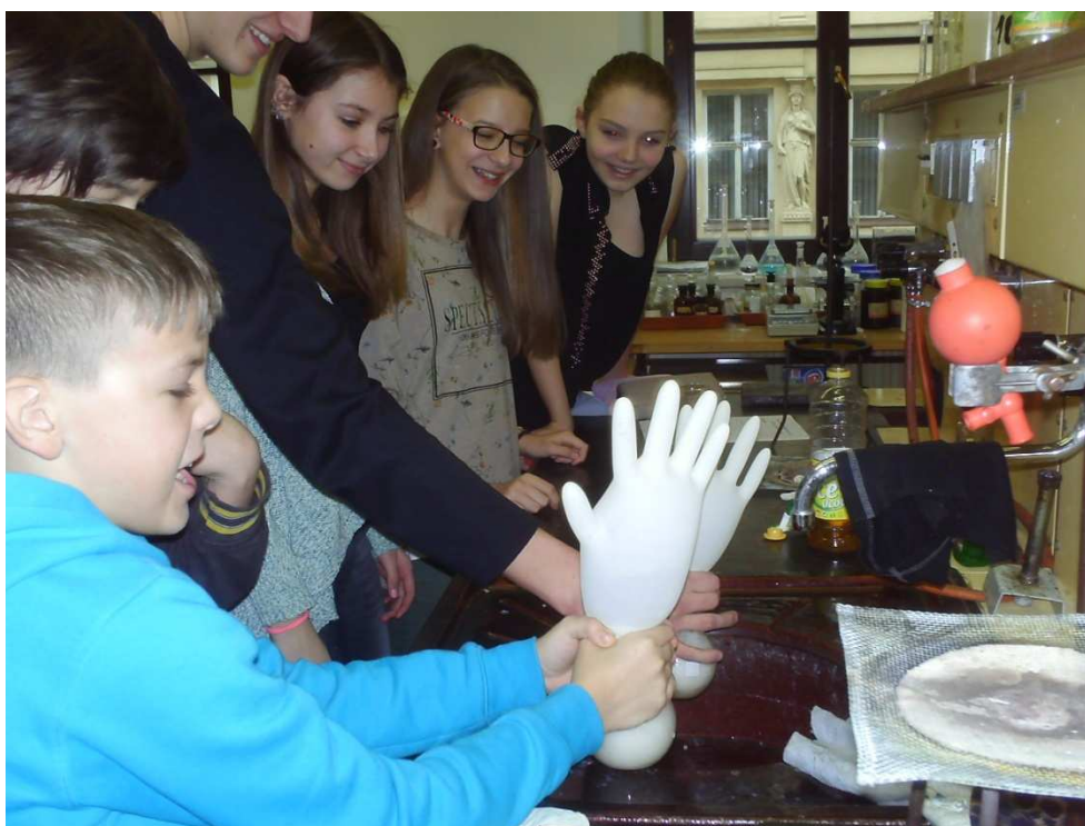
Projektový den pro ZŠ - Jaroška

V tomto školním probíhala výuka nepovinného předmětu náboženství.