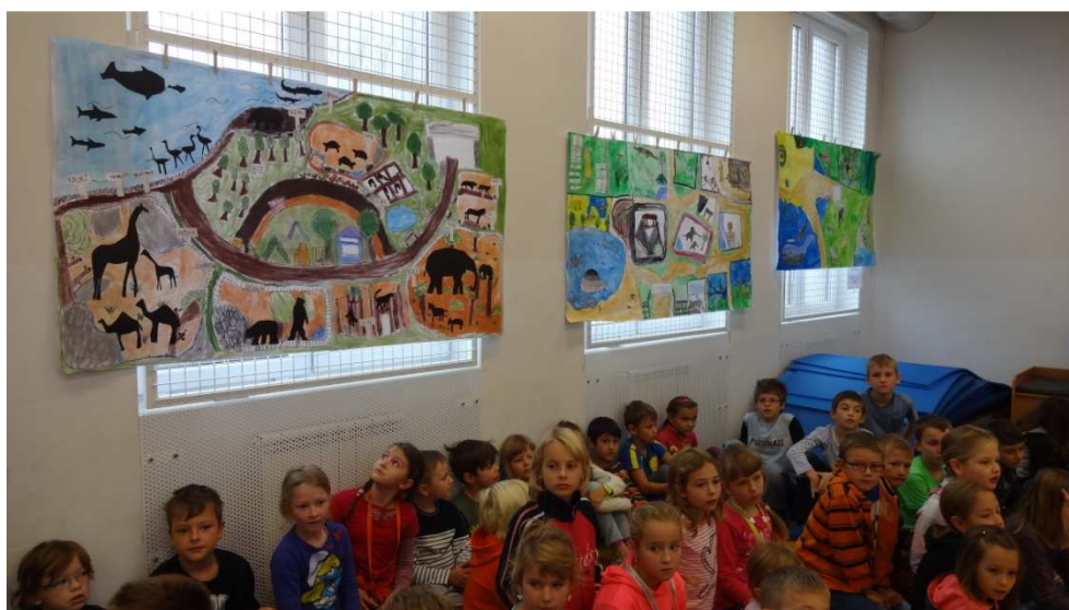
Den Jazyků - prezentace prací jednotlivých tříd - ZOO

V tabulce jsou uvedeny souběžné pracovní poměry zaměstnanců a ženy na mateřské a rodičovské dovolené. Údaje platné k 30. 6. 2015.