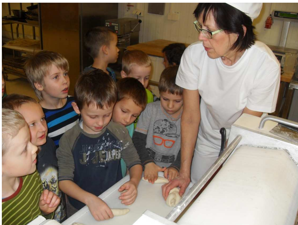
Tesco – vánoční tvoření