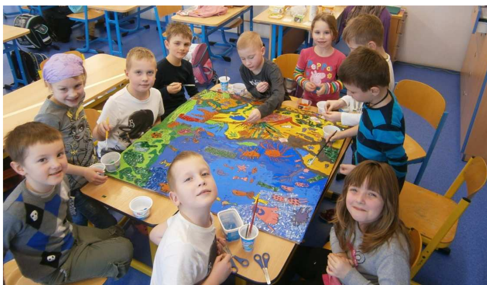
ŠD – tvorba obrazu – podmořský svět

Pravidelně se děti ŠD zapojovaly svými vystoupeními do školních akcí jako školní vánoční jarmark a školní akademie. Se svými vánočními a velikonočními pásmy a s divadelním představením vystoupili i na nám. Svobody v Brně, zavítali i do obou modřických domovů pro seniory. Pěvecký sbor Zpěváček každoročně vystupuje v programu při slavnostním rozsvícení vánočního stromu v Modřicích.