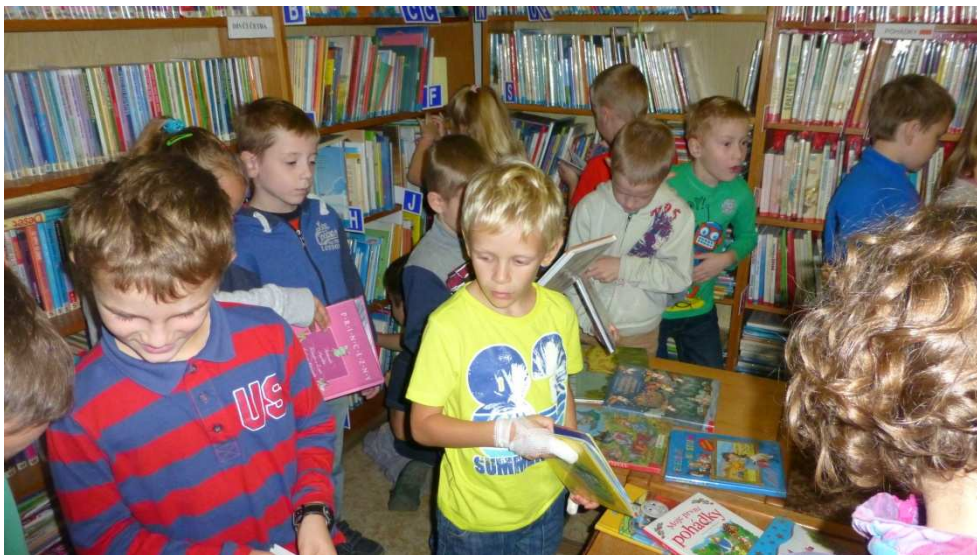
Poprvé v knihovně

Do výuky se zaváděly nové prvky, které reagovaly na současné trendy a potřeby žáků. Jednalo se např. o projekt Investování hrou v rámci programu Vzdělávání pro konkurenceschopnost, do kterého se zapojili učitelé s žáky 8. a 9. ročníku. Žáci se tak díky tomuto ojedinělému projektu dozvěděli mnoho z oblasti financí a prohloubili tak svou finanční gramotnost. Dále byla naše škola zapojena do projektu Rodilí mluvčí do škol- zvyšování jazykové vybavenosti žáků základních škol pomocí rodilých mluvčích. Práce cizinců byla rozhodně pro výuku přínosem a zpestřením, žáci tak byli motivováni k aktivní komunikaci v cizím jazyce.