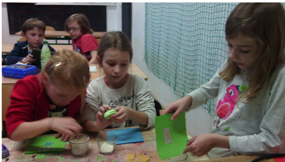
ŠD děti vyrábí náramky z korálků a paměťového drátu ke dni matek

Zájmová činnost byla rozličná, pestrá a mezi žáky oblíbená. Svými výrobky se děti podílely na realizaci školních výstav, tanečními vystoupeními pak přispěly do programu školních i městských společenských akcí.