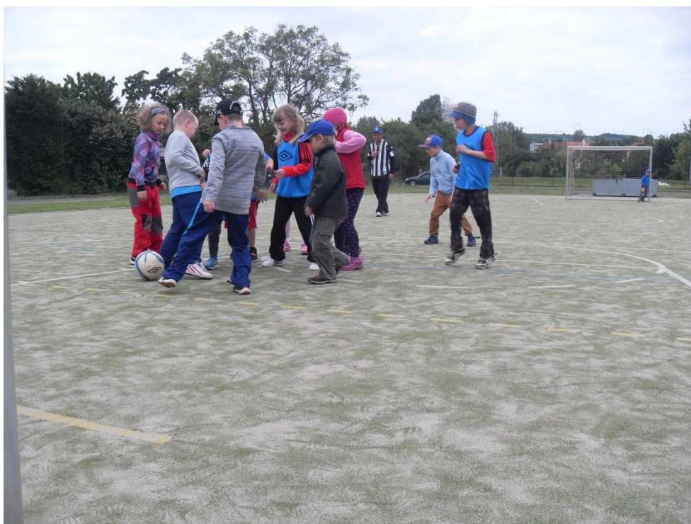
Sportovní den v ŠD