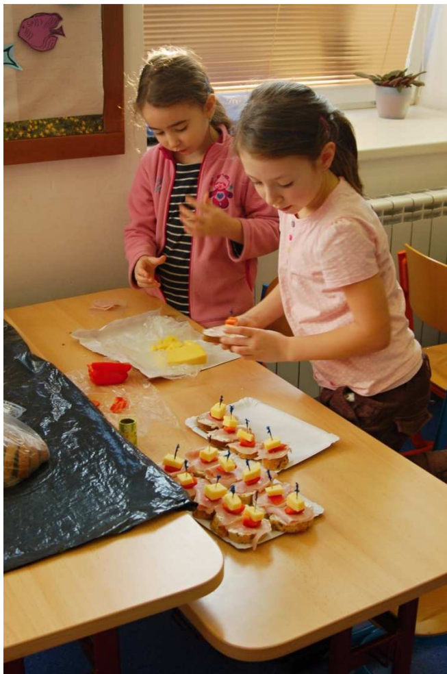
Chystáme zdravou svačinku - prvouka