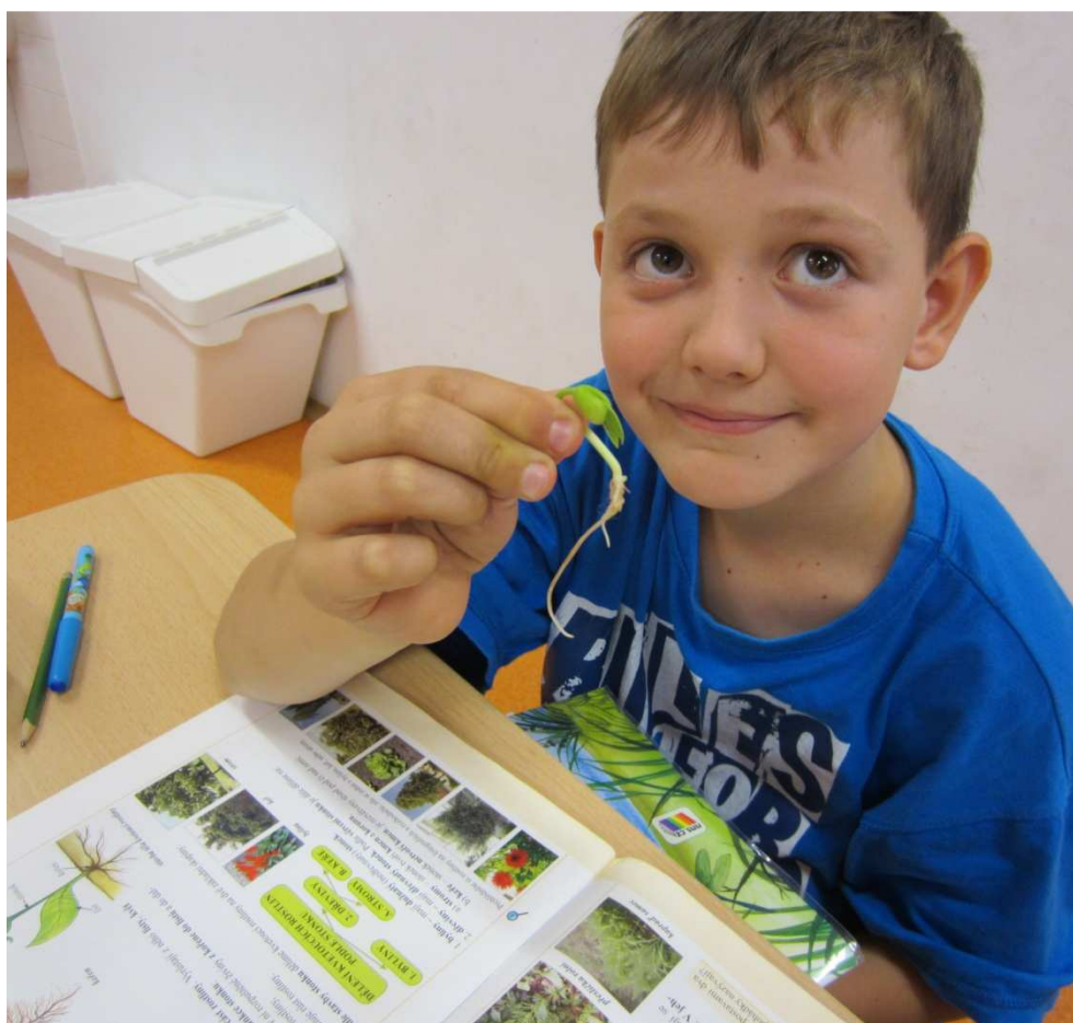
Přírodověda – zkoumáme rostliny