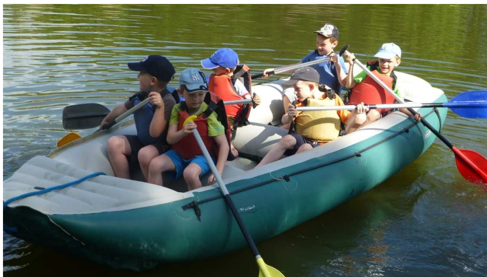
Škola v přírodě

Po dokončení stavby sousedícího domu pro seniory mohlo dojít též k ukončení úprav školního pozemku kolem budovy školy na ulici Komenského. Na místě bývalé školní zahrady a přilehlých školních pozemků bylo vybudováno nové odpočinkové a hrací hřiště. Celý areál je určen především pro děti školní družiny při jejich odpoledních aktivitách, během dopoledne ho mohou během hlavní přestávky využívat i žáci 1. stupně. Děti získaly mnohem větší prostor ke hře i k odpočinku. Navíc si zde mohou cvičit svou mrštnost a obratnost. Školní zahrada tak dostala zcela novou, moderní tvář.