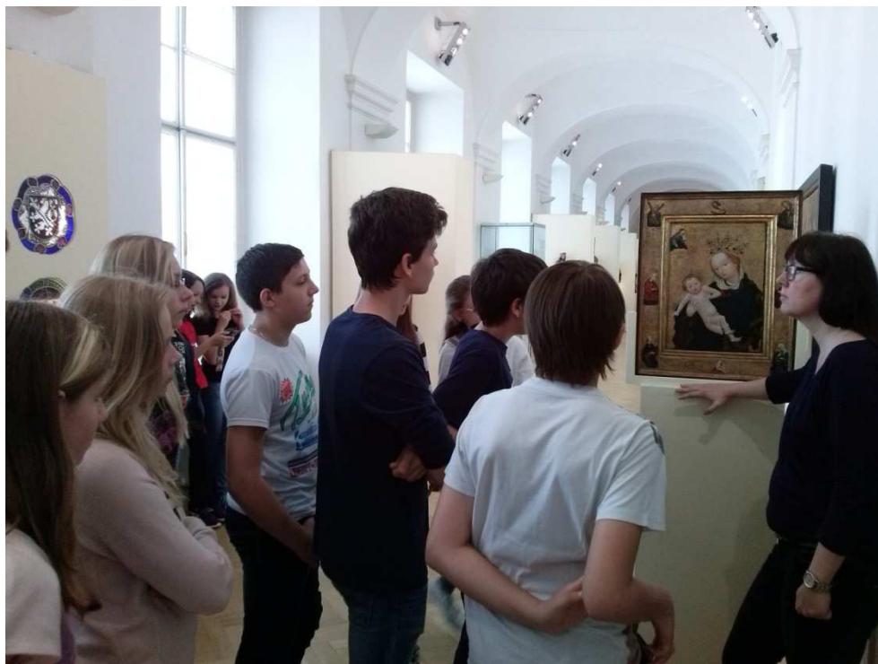
exkurze o gotice a baroku v Moravské galerii v Brně.jpg

Každý rok také vybavíme kuchyň nějakou novou technologií. Letos nám přibyla nová myčka nádobí, která kapacitně zvládne současný nápor žáků v jídelně a dva kombinované sporáky.