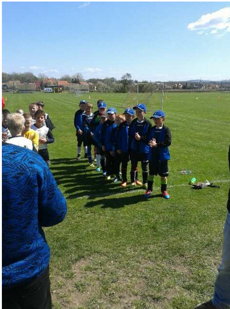
McDonald Cup, fotbalový svátek, kategorie 1. - 3. třída