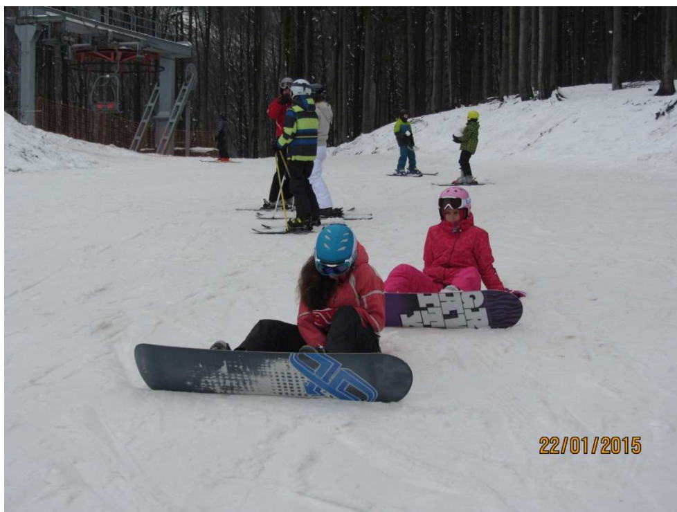
Zimní pobyt Filipovice

V rámci výuky jsme žáky zapojovali do olympiád a vědomostních soutěží. Pro žáky devátého ročníku jsme podruhé zorganizovali čtyřdenní pobytový zájezd zaměřený na přípravu k přijímacím zkouškám na střední školy. Žáci nás velmi překvapili svým aktivním přístupem a velkou snahou, a proto jsme se těšili z jejich úspěchů. Z počtu osmnácti žáků umístěných na střední školy s maturitou byli čtyři žáci přijati na brněnská gymnázia. Z 5. ročníku pak usedne do gymnaziálních lavic sedm žáků, ze 7. ročníku odchází studovat na gymnázia dvě žákyně.