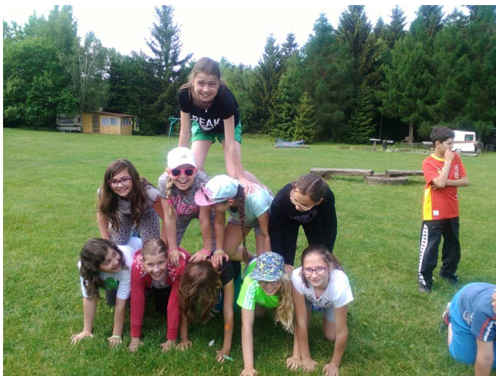
Škola v přírodě