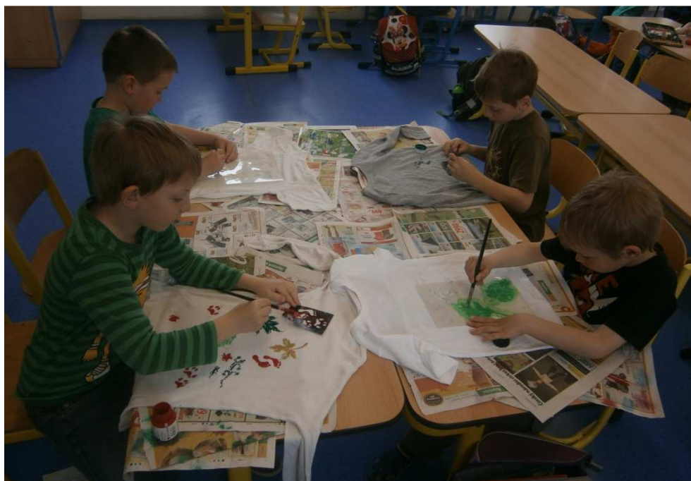
ŠD – malujeme na trička

V rámci projektu „Vzdělávání pedagogů v cloudu“ bylo 20 pedagogických pracovníků proškoleno pro práci s dotykovým zařízením, prezentačními nástroji, pravidly pro tvorbu prezentací a normami pro psaní textu. Dále bylo pořízeno pedagogickým pracovníků 20 tabletů a částečně byla škola pokryta bezdrátovým připojením. V návaznosti v dalších letech hodláme pořídit tablety i pro výuku žáků.