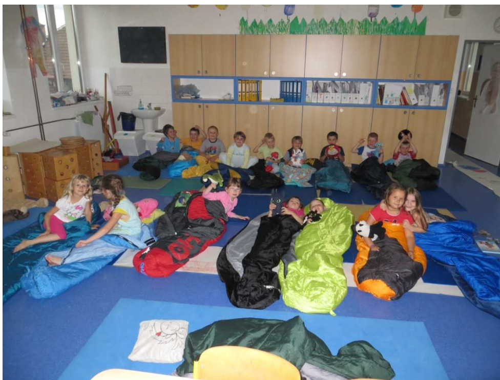
Předškoláci – spaní ve škole

Cílem projektu Škola před školou bylo systematicky připravovat děti k úspěšnému nástupu do první třídy. Vzdělávací program byl upraven takovým způsobem, aby v co nejvyšší míře vyhovoval individuálním potřebám každého dítěte a umožnil tak snadnější začlenění do následného vyučovacího procesu v první třídě. Hravou a motivační formou postupně učít děti školnímu režimu, soustředěnosti, zvládnutí úkolů a školních povinností. Denní režim byl ve třídě uzpůsoben s ohledem na individuální potřeby každého dítěte. V hodinách, které nepodléhaly časové dotaci klasické vyučovací hodiny, jsme se zaměřili na stimulaci všech perцепcí, grafomotoriky, matematických představ, zrakového vnímání, sluchového vnímání, řeči, pozornosti, opět s ohledem a respektováním aktuální úrovně dovedností každého dítěte. Organizace výuky byla zaměřena jak na individuální práci a stimulaci perцепcí, tak i na skupinové činnosti a tím i posilování sociálních a komunikačních dovedností.