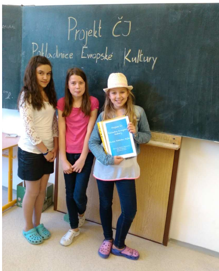
Projekt „Pokladnice evropské kultury“

Výchovně vzdělávací proces probíhal standardně ve dvou budovách, které byly po předcházejících letech úprav a rekonstrukcí uvedeny do velmi dobrého stavu. Zeleň v okolí školy na Benešově ulici byla revitalizována, nyní se pečlivě udržuje trávník i okrasné záhony.