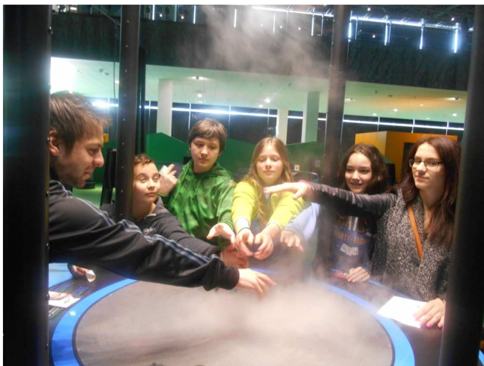
Vida centrum 8. třída