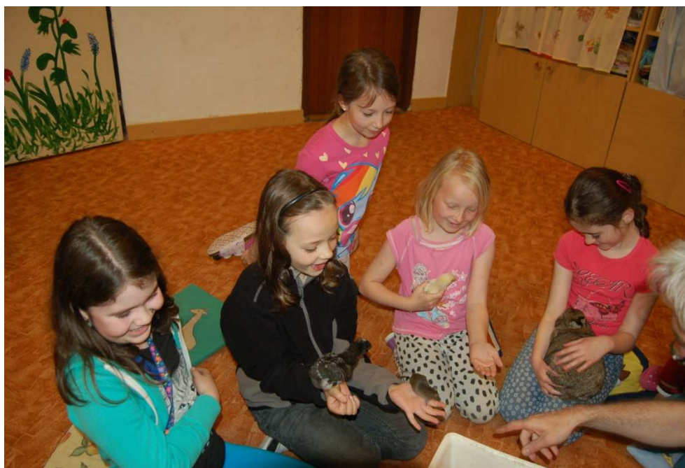
Seznamujeme se s domácími zvířaty v CVČ Bystrouška

Rodiče mohou školu navštívit kdykoliv po vzájemné dohodě s vyučujícím, v době konzultačních hodin, na třídních schůzkách nebo v úředních dnech (je-li vhodné, mohou být žáci přítomni při jednání rodičů a učitele). O činnosti a aktivitách školy jsou rodiče pravidelně informováni na webových stránkách školy a v modřickém Zpravodaji.