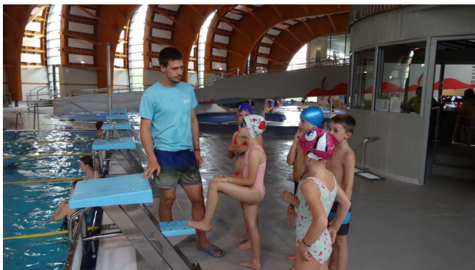
Plavecký výcvik Kohoutovice