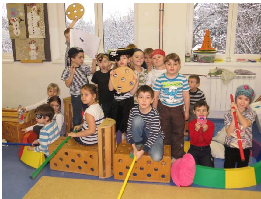
Předškoláci – námořnické vysvědčení