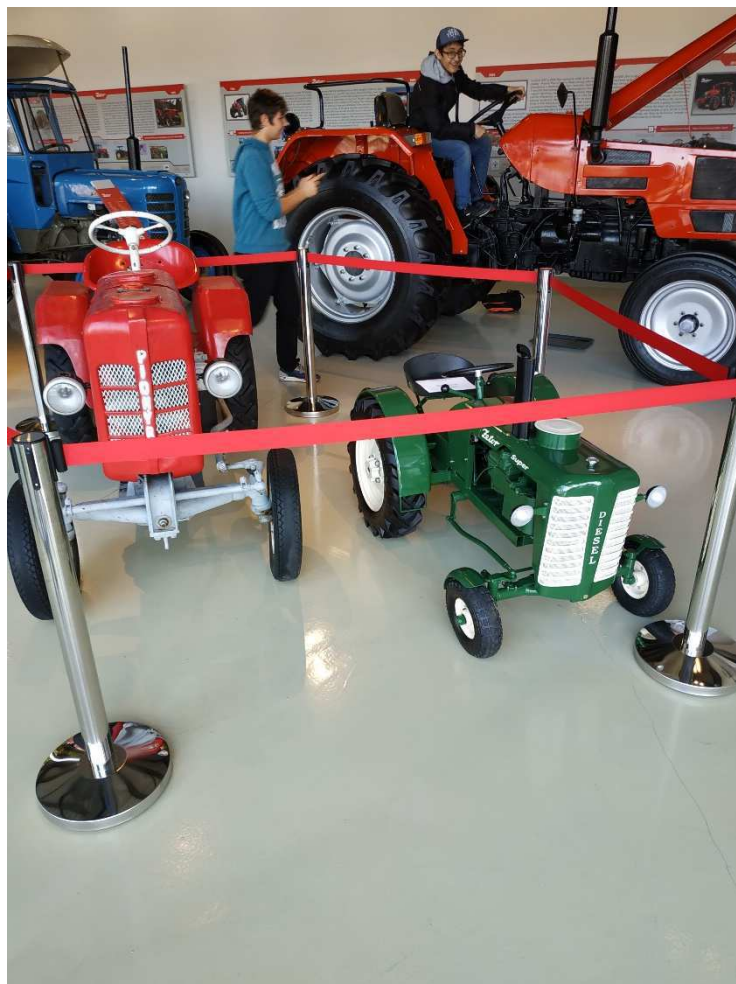
Zájemové dny - průmysl, Zetor Gallery Brno

Materiálně-technické vybavení a zabezpečení umožnilo bezproblémový chod školy. V obou budovách docházelo dle potřeby k drobným opravám, probíhala běžná údržba (výmalba chodeb, nátěr šaten, instalace nového zabezpečovacího zařízení apod.). Velkým přínosem bylo otevření sousedící městské sportovní haly a její vnitřní propojení s naší školou podzemním tunelem, což významně usnadňuje a urychluje přesun žáků během přestávek do tělocvičny.