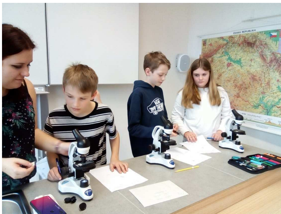
V.A přírodovědné bádání pod mikroskopem

Dne 11. března však škola uprostřed všeho dění utichla, byl vyhlášený nouzový stav. Všichni jsme se museli v nově situaci rychle zorientovat a přejít na nový způsob vzdělávání z domova, na vzdělávání distanční.