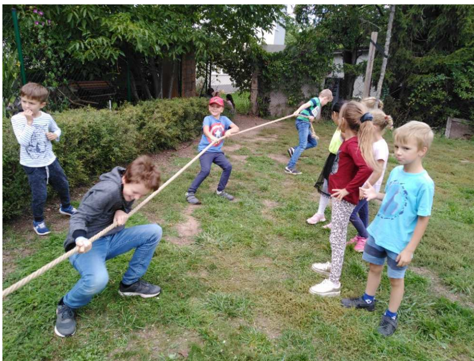
ŠD hry na zahradě

Oddělení ŠD navštívilo společné akce: beseda v modřické knihovně s ilustrátorem Adolfem Dudkem, vánočního jarmarku, návštěvy v pasivním bytovém domově pro seniory na vánoční tvoření seniorů. Také se žáci tento rok ve velkém počtu zajímají o hře šachu. Účast v Zastávce byla výborná, žáci dosáhli na 2. A 5. umístění.