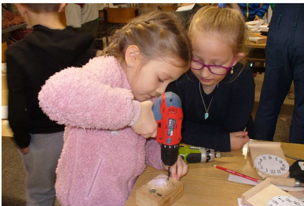
Pracovní činnosti - práce s balzou 2. ročník