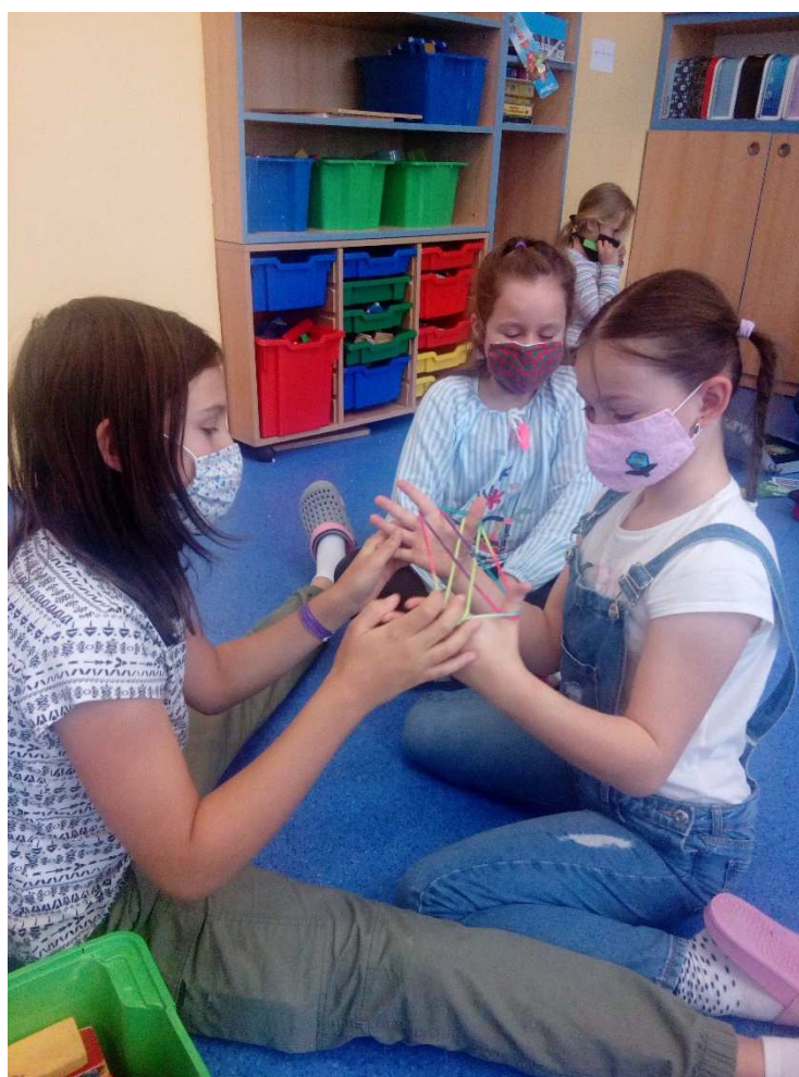
Koronavirus ŠD hry

Školní družina pracovala v prostorách těchto tříd: 1. oddělení ve 3.B, 2. oddělení ve 4.B, 3. oddělení v 3.A, 4. oddělení v 1.A, 5. oddělení v 1.C, kde je i ranní provoz ŠD a 6. oddělení ve třídě 4.A zde i ranní ŠD. Vyzvedávání žáků je umožněno pomocí čipů u systému Bellhop společnosti NeurlT, který plně využíváme pro odpolední docházku, vedení třídní knihy, zapsání všech aktivit a kroužků, která žáci navštěvují. Stále máme přehle o pohybu žáků na naší škole.