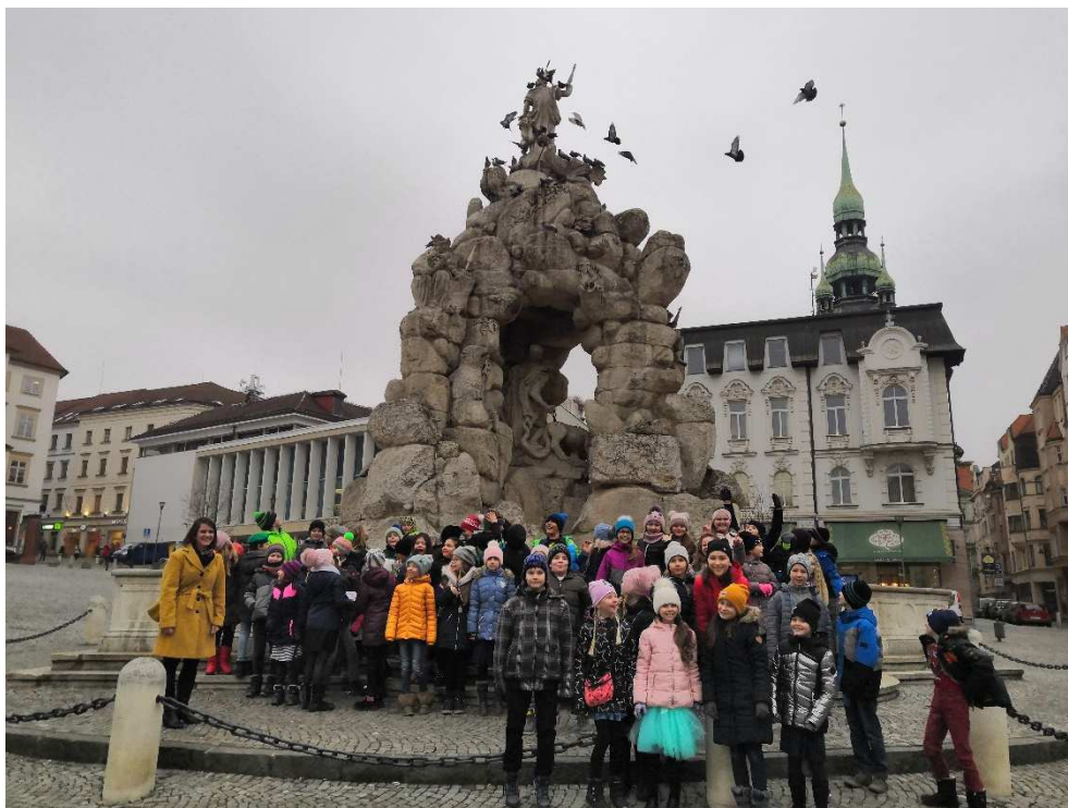
Návštěva Brna - 3. ročník

Pravidelně 1x týdně jsme konzultovaly se školní speciální pedagožkou Mgr. Koláčkovou zajištění péče o žáky se SVP.