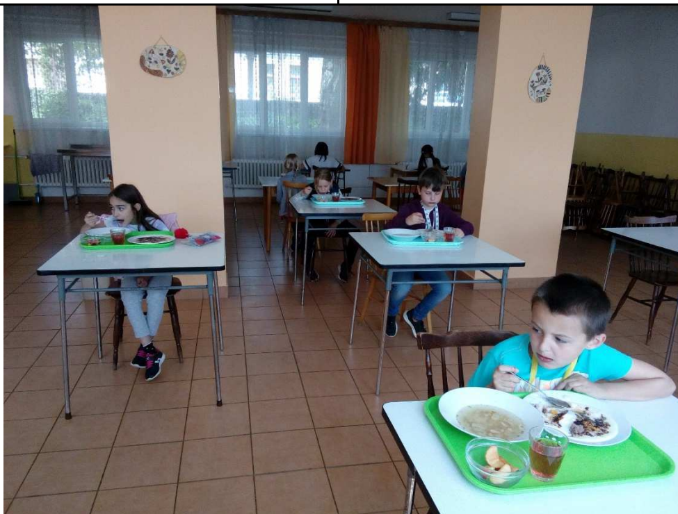
Stravování v jarních měsících