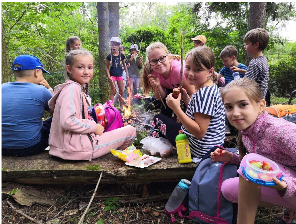
Adaptační výlet III.A