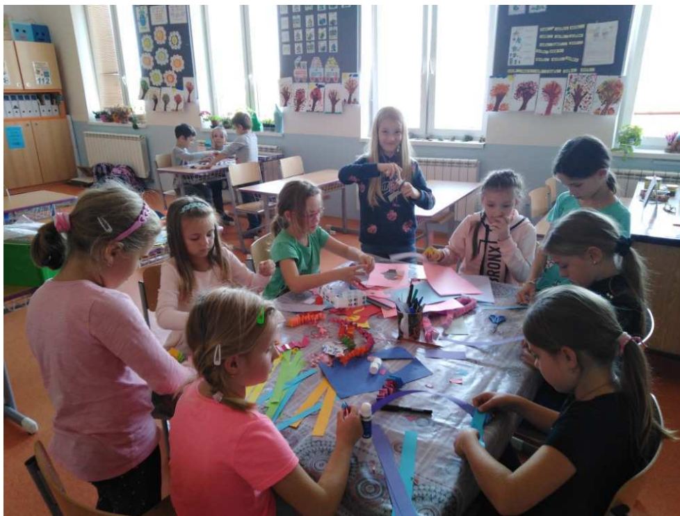
ŠD výtvarné tvoření