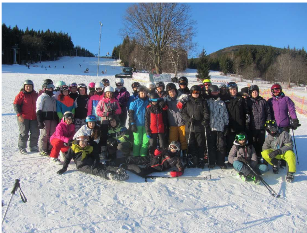
Lyžařský kurz Filipovice