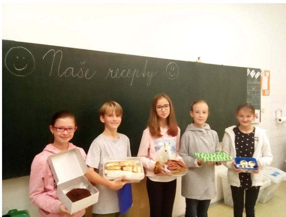
Hodina slohu - naše oblíbené pokrmy

Škola neposkytuje vzdělávání v rámci celoživotního učení. Naši zaměstnanci se účastní seminářů, školení a jiných aktivit v rámci celoživotního vzdělávání – viz kapitola 7.