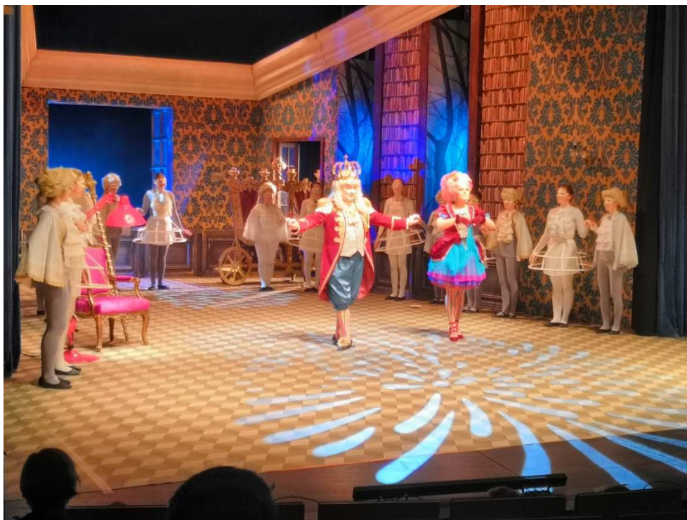
Reduta v Brně, leden 2020, představení Kocour v botách - balet, 3. ročník