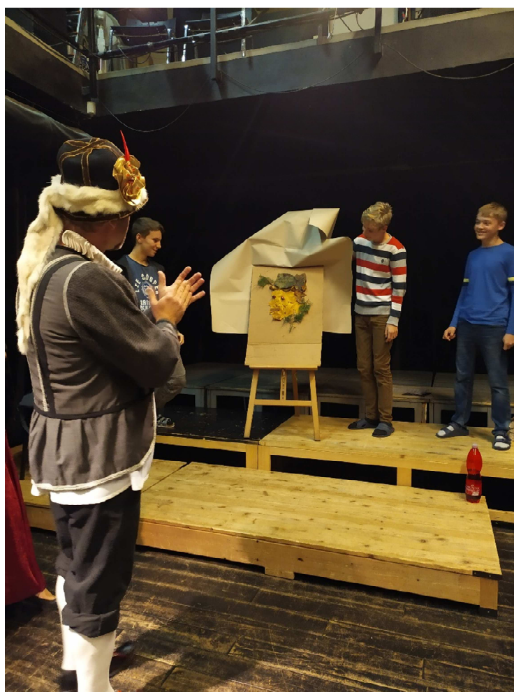
Umělci představují císaři Rudolfovi II. jeho podobiznu

Materiálně technické zázemí obou budov je na dobré úrovni. Vzhledem k narůstajícímu počtu žáků, pedagogů a asistentů pedagogů stále vytváříme a zařizujeme nové prostory, které odpovídají současným potřebám. V budově na ulici Komenského jsme zařídili nový kabinet pro učitele a jednu pracovnu pro speciálního pedagoga.