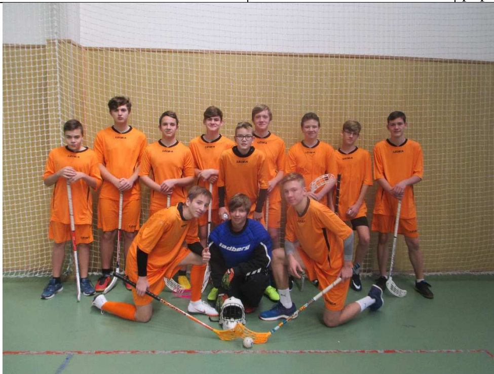
Florbalový turnaj starších žáků (8. + 9. ročník)