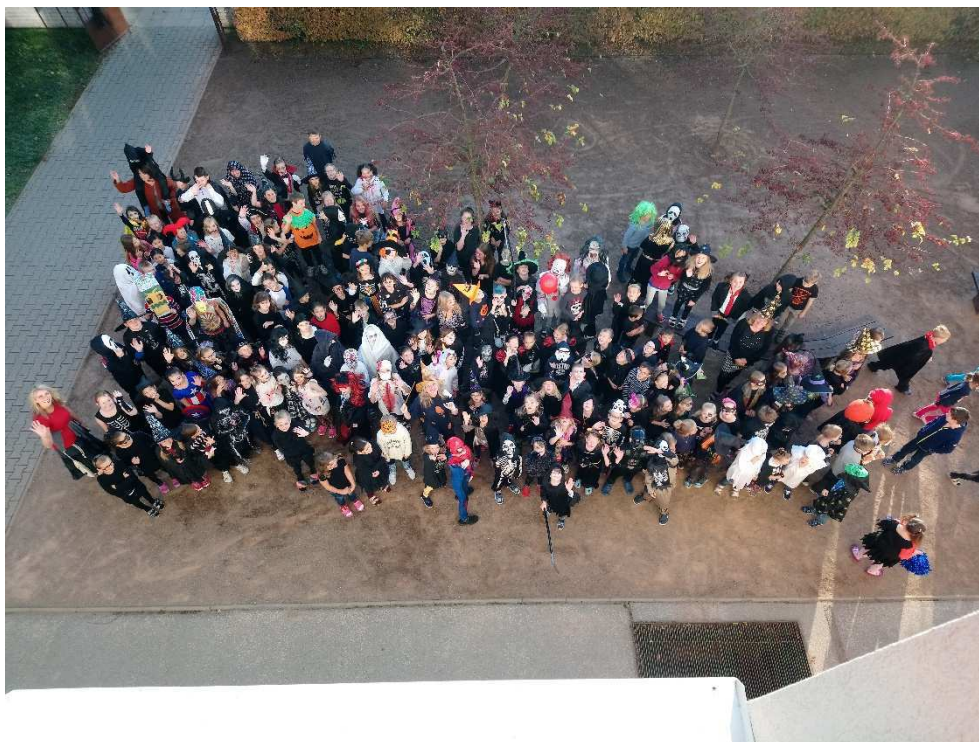
Halloween na budově Komenského

školy jsou rodiče pravidelně informováni v elektronickém systému edookit, na webových stránkách školy a v modřickém Zpravodaji.