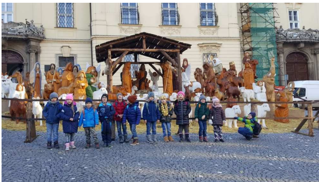
Vypracovala : Veronika Matochová

Pro rozvíjení pohybových dovedností a poskytnutí dětem dostatek prostoru a pobytu na čerstvém vzduchu, jsme také hojně využívali zahrady školy i školky. Během celého školního roku jsme pravidelně navštěvovali divadelní a hudební představení. Předvánoční chvíle jsme také prožívali společně s rodiči, pro které jsme připravili divadelní představení. V únoru jsme strávili sportovní den v Jumpparku. Na konci školního roku získaly děti vysvědčení v podobě obrázku a slovního hodnocení. Rodiče si převzali zprávu o průběhu školní přípravy a vyhodnocení plán pedagogické podpory.