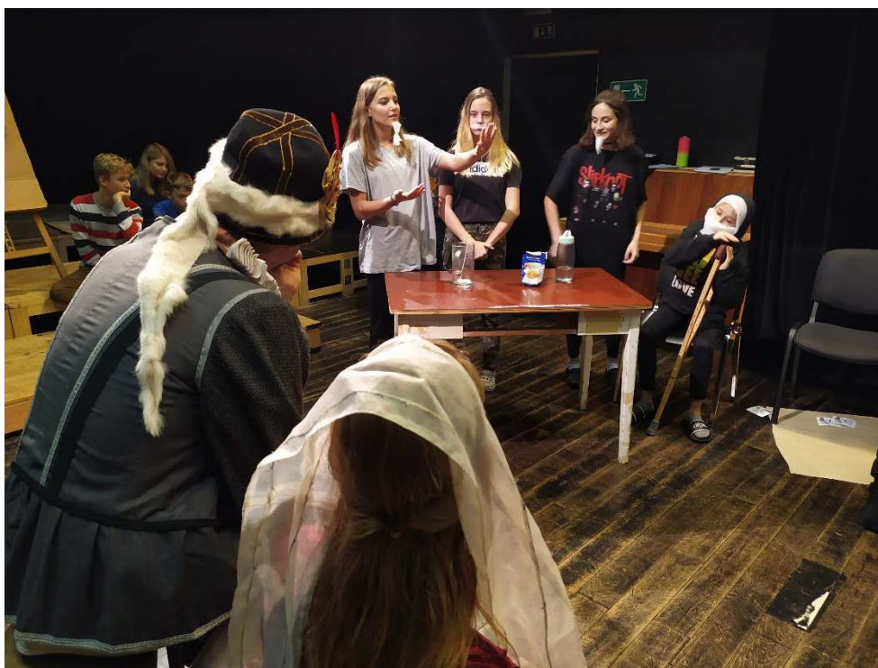
Alchymisté připravují pro císaře Rudolfa II. elixír mládí

Část projektů se nekonala z důvodu uzavření školy.