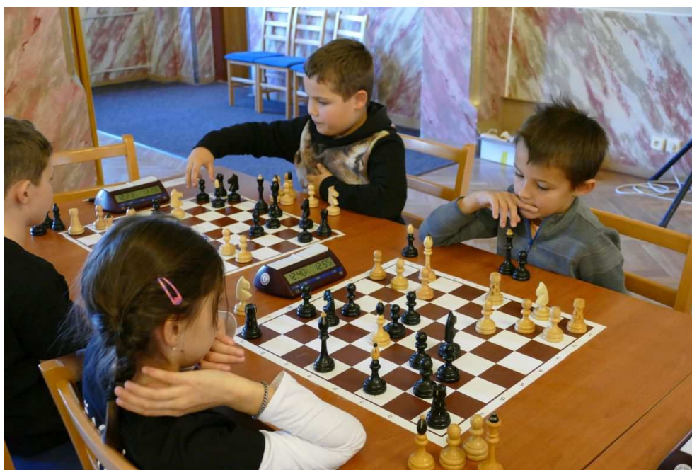
Šachový turnaj - Zastávka